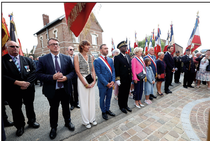
Une partie de l'assistance lors du 80ème anniversaire de la libération de Saint-Quentin