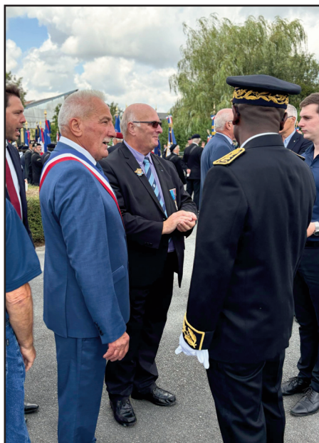
Présence de notre président

L'ordre National du Mérite, dans le cadre du devoir de mémoire, était bien représenté lors de ces commémorations.