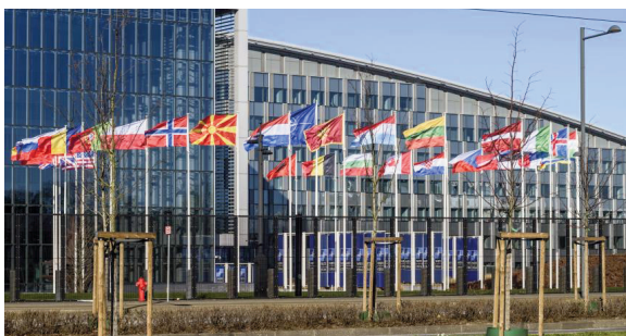
Immeuble abritant le Grand Quartier Général des puissances alliées en Europe (SHAPE)

● « Sur les traces de Van-Gogh », En effet le célèbre peintre a vécu dans la région où il était alors pasteur, avant de poursuivre sa route et sa carrière jusqu'à Auvers-sur-Oise où il repose. Visite de ses deux demeures à Cuesmes et à Wasmes.